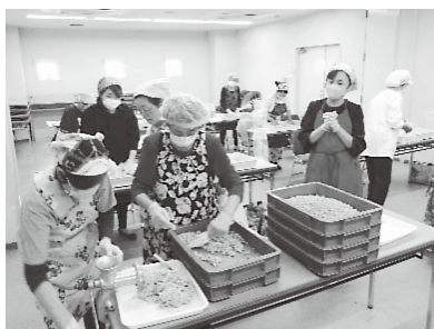
ゆでた大豆をつぶす様子