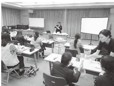
美容研修会の様子

「しみ・しわ・たるみについて学ぶ!美肌への第一歩『マイナス5歳肌へ』」をテーマに、試供品を使用して実践を交えながら、肌に優しいスキンケアを学びました。