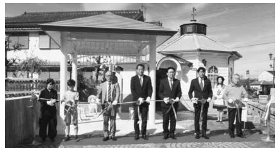
リニューアル式典での関係者によるテープカット

今回のリニューアル工事は、船小屋鉦泉開湯200周年を記念し、筑後市制70周年記念事業の一環として行われたものです。