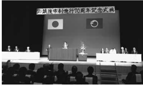
市制施行70周年記念式典

10月19日(土)、サザンクス筑後において、筑後市制施行70周年記念式典が行われ、来賓の方々、各行政区長や関係団体、約800名が参加されました。