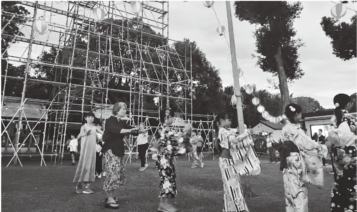
溝口竈門神社千燈明大祭（9月14日）