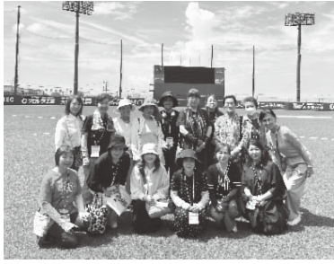
タマスタ筑後のグラウンドにて

スタンド席にて、タマスタ筑後の球場概要や座席の説明を聞いた後、ガイドの案内により、グラウンドやダグアウト(ベンチ)、最新の設備がある屋内練習場サブグラウンドを見学しました。